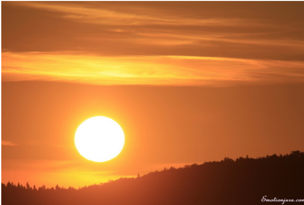
07h04, le soleil brillait de tous ses feux et chauffait vite l'ambiance